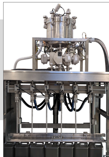
Boquillas de llenado