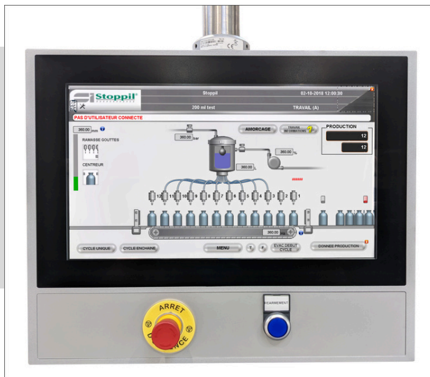
Pantalla táctil a color de 15"